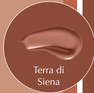
Terra di Siena